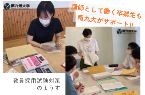
教員採用試験対策 のようす